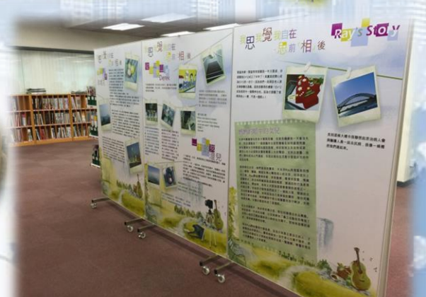
香港柴灣公共圖書館