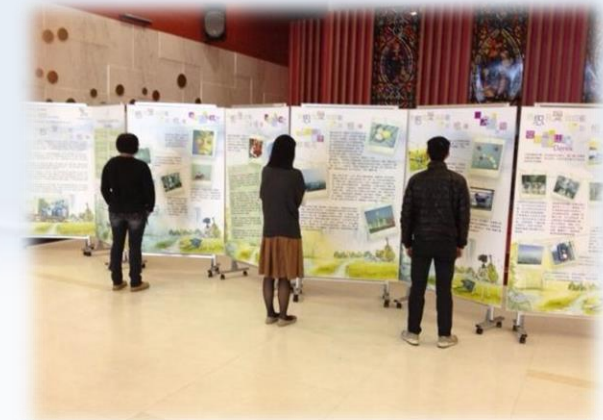
東區尤德夫人那打素醫院東座地下