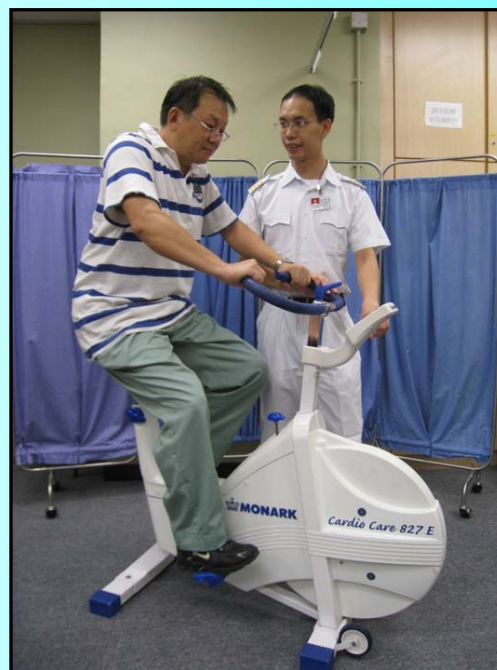
呼吸系統問題處理