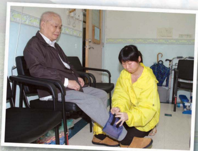
社區復康計劃中有註冊物理治療師及工作人員協助參加者在社區進行復康治療