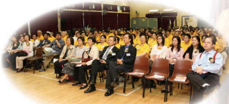
所有義工穿上黃色的制服出席嘉許典禮，令全場充滿朝氣

為嘉許義工的努力及驕人的成績，2007年5月19日已順利完成簡單而隆重的嘉許典禮，當日有不少港島東聯網的管理層、六間長者服務機構的主管及受惠長者出席支持義工，而義工更用話劇、魔術、訪問等形式分享訓練及服務時的經驗及得著，從他們燦爛的笑容中，足見他們從奉獻中得到無限的心靈滿足。