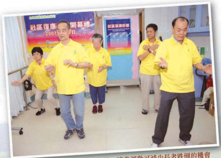
耆康會一班長者正表演太極示範，適當運動可減少長者跌倒的機會