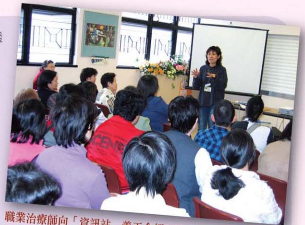
職業治療師向「資訊站」義工介紹工作時要注意的事項。

現時共有來自五個復康機構的九隊社區復康服務團隊參與「精神健康資源站」，包括：浸會愛群社會服務處、利民會、善導會、扶康會及東華三院。服務自2002年10月開展以來，得到不少醫護人員、康復者及家屬的支持及正面評價，開放時間及使用人數不斷增加；2006年4月更擴展服務，增設健康資訊借用服務。我們聯合精神科日間醫院醫護人員及社區復康機構社工，訓練康復者及病人家屬擔任義工，協助服務運作；至目前為止，已訓練了近百位康復者及病人家屬義工參與服務，發揮互助精神。