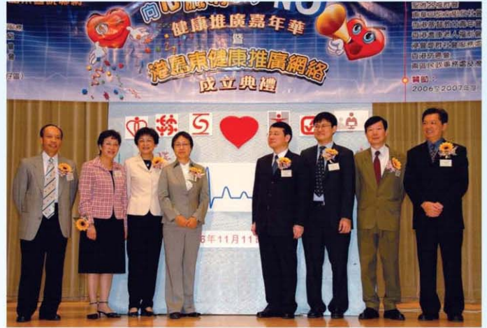
主禮嘉賓按動台上代表「港島東健康推廣網絡」的「心」，宣佈「港島東健康推廣網絡」正式成立。