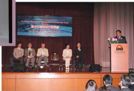
主禮嘉賓之一的衛生福利及食物局局長周一嶽醫生亦參與是次研討會，認同醫社合作是改善市民健康質素的一環

當天，大會更加設論文分享時段，挑選了16份計劃，邀請各計劃負責人分享多年來的經驗，令研討會更見豐富。最後，聯網社區服務總監王春波醫生對是次研討會之成功感到欣慰，鼓勵與會者繼續努力及多作交流，向共建優質的社區照顧邁進。