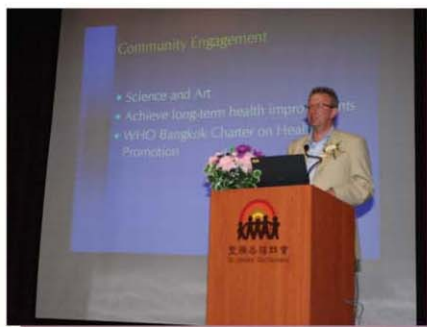
醫院管理局行政總裁蘇利民先生在會上分享醫社合作需要多方配合