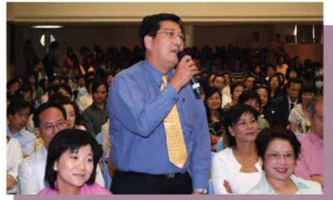
當日有四百多位參加者到場，大家亦熱烈地參與討論。

研討會開幕禮主禮嘉賓包括衛生福利及食物局局長周一嶽醫生、醫院管理局行政總裁蘇利民先生、香港耆康老人福利會執行委員會主席馮康醫生、聖雅各福群