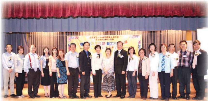
主禮人及多個社區伙伴到場支持及嘉許義工的努力

「健康先鋒惠社區」是港島東醫院聯網與社區伙伴建立「醫社合作」及「社區為本」服務的一個成功例子。成功集結醫院、長者服務機構、義工及社區伙伴的力量，互相貢獻所長，發展一個聯網性、跨界別的社區關顧網絡。透過義工將健康訊息及疾病預防資料傳遞給長者，義工更會協助評估長者在日常生活中的高危因素，從而及早由專業社工作出介入，務求減低長者不必要的入院，亦大大提高體弱長者的健康水平及生活質素。