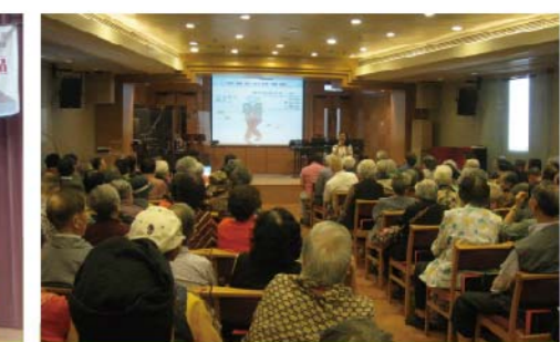
與循道衛理灣仔長者服務中心合辦的「左鄰右舍『愛您一家』計劃 長者防寒講座」於2013年11月6日舉行，向東區及灣仔區的長者分享防寒資訊。