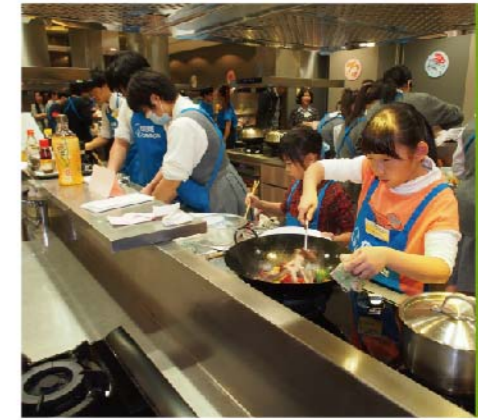
「譜出健康新『煮』意烹飪比賽2013」已於2013年12月14日在煤氣公司烹飪中心舉行。當天各參加者化身廚神，齊齊烹調健康有「營」菜色。

由社區人士提名，由評審團評選出十位「灣仔精神大使」以作嘉許，以發掘具灣仔精神的人物和故事，顯示灣仔社群堅毅不屈、無私奉獻、關愛互助的精神。十位「灣仔精神大使」的精彩故事將編輯成《灣仔故事冊》，闡述他們的灣仔故事及為建設一個美好的社區所作出的貢獻。