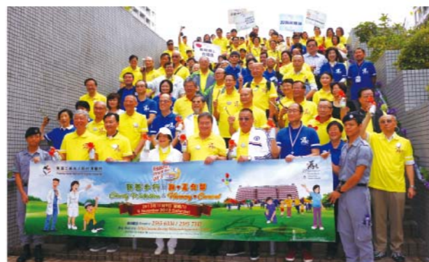
慈善步行由前醫管局主席胡定旭的帶領下出發,亦開展了東區醫院新一頁。

為慶祝東區尤德夫人那打素醫院成立二十週年,「東區醫院日2013慈善步行及融♥嘉年華」已於2013年11月9日順利舉行。活動當日非常熱鬧,除了本院同事的參與外,還有超過90個社區團體包括病人組織、學校、居民組織、社會服務機構及義工團體參與。而步行籌款的參加者人數亦打破歷年紀錄,所籌的款項會全數捐予「那打素慈善信託基金」作改善醫院服務,為區內的市民提供更優質醫療服務。不少的社區伙伴都表示活動能加強醫社之間的聯繫,並希望繼續參與本年度的「東區醫院日」。約定您們了!