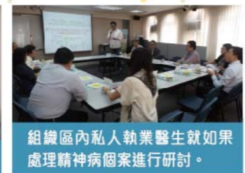
組織區內私人執業醫生就如果處理精神個案進行研討。