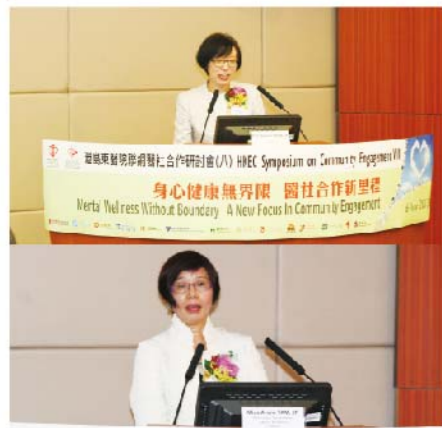
嘉賓講者於主題演講及專題演講中，從醫護界、社福界、學者及照顧者的角度，探討醫社合作如何促進不同組群的精神健康，以及從個人上如何有健康的心理質素，及早推廣精神健康的重要