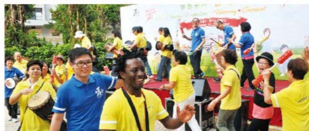
非洲鼓表演「鼓」動全城,帶動台下觀眾一起舞動,氣氛十分融洽!