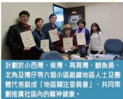
計劃於小西灣、柴灣、筲箕灣、鯉魚涌、北角及灣仔等六個小區組織地區人士及團體代表組成「地區關注委員會」，共同策劃推廣社區內的精神健康。

「家」陪同心社區網絡計劃是一項由浸信會愛羣社會服務處及利民會合辦的計劃，以東區尤德夫人那打素醫院作為策略伙伴，透過凝聚社區資源，注入不同知識及經驗，加強區內和諧、關注及推動身心精神健康的氣氛。計劃集結了社區內的醫(醫護)、社(社福/社區)、家(家屬)的資源，攜手建立精神病患者及家屬與社區的網絡。計劃於2012年4月開展至今已成功結集各方持份者，以講座、工作坊、資訊站、義工計劃、委員會會議等不同形式於社區內攜手建構精神健康的社區。