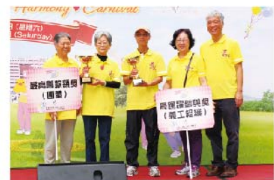
東區醫院義工團隊獲得了本年度最高籌款額獎(組織),同時亦是最踴躍參與獎(義工組織)得主。