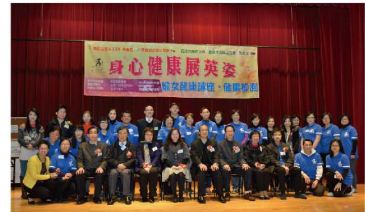
由2013年5月開始至2014年2月，醫社共融系列從多方面加深市民對健康生活的認知，亦促進了醫院與社區之間的溝通。