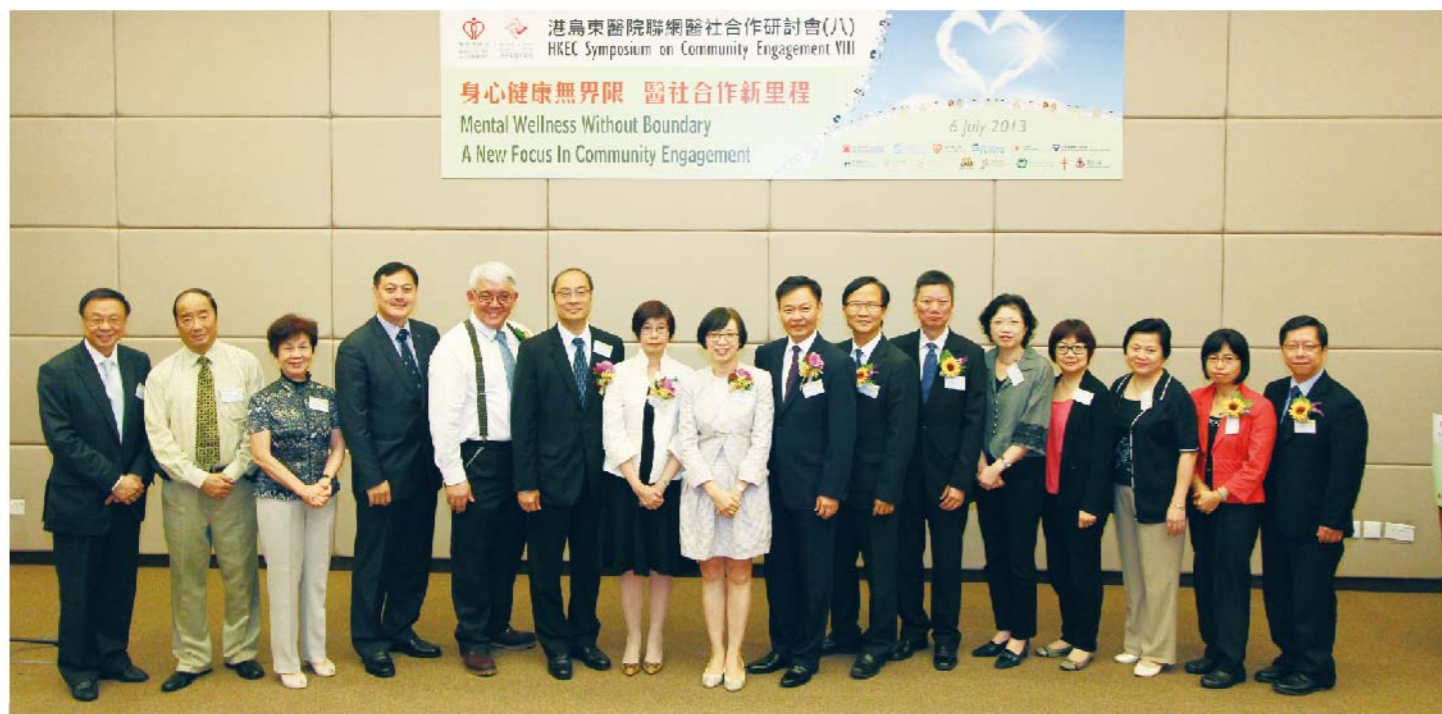
研討會嘉賓雲集，嘉賓包括食物及衛生局副局長陳肇始教授、勞工及福利局常任秘書長譚韓蘭太平紳士、醫院管理局行政總裁梁栢賢醫生太平紳士、港島東醫院聯網總監劉楚釗醫生、港島東醫院聯網基層及社區醫療服務總監王春波醫生太平紳士、研討會籌備委員會主席凌信會愛華社會服務處總幹事曾永強先生及港島東醫院聯網基層及社區醫療服務副總監朱偉星醫生，為研討會拉開序幕

今屆研討會的主題是「身心健康無界限 醫社合作新里程」。內容準備亦相當豐富，全日合共二十七個演講，更透過答問及討論環節，講者與參加者的互動及交流，共同探討醫社合作進一步的方向和發展。此次研討會的花絮及嘉賓演講資料已上載於「港島東健康資源網」( http://www.healthyhkec.org/ )。