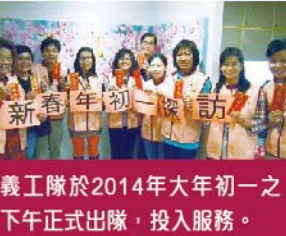
義工隊於2014年大年初一之下午正式出隊，投入服務。

「支援長者離院綜合服務」在2011年10月於港島東醫院聯網全面推行，為可能再次緊急入院的高危長者提供出院後的專業護理、復健、專業介入及家居支援服務，以減低他們再次緊急入院的風險。經過兩年多的服務經驗，發現長者往往在8星期的服務後仍有關顧或監察的需要。故此，透過港島東醫院聯網社區服務的協作，成立「離院支援義工隊」，目標為持續探訪及跟進曾接受支援長者離院綜合服務之長者，延續多最長6個月的跟進，期望加強長者與社區的聯繫，並更妥善地續後跟進。