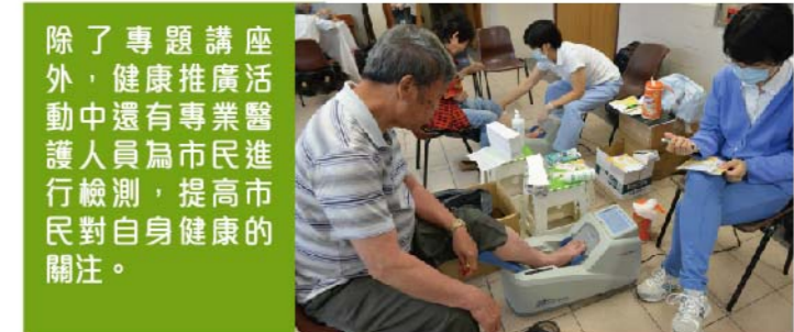
除了專題講座外，健康推廣活動中還有專業醫護人員為市民進行檢測，提高市民對自身健康的關注。