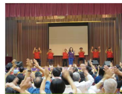
參加者跟隨台上示範學習保健運動，在家也能輕輕鬆鬆練習，實行「日日運動身體好」。