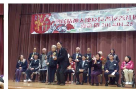
「灣仔精神大使」嘉許禮於2014年1月25日舉行，藉此表揚具灣仔精神的人物和故事，嘉許「灣仔精神大使」，促進社區歸屬感及社區共融。