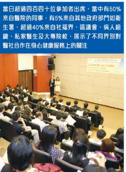
當日超過四百四十位參加者出席，當中有50%來自醫院的同事，有5%來自其他政府部門如衛生署，超過40%來自社福界、區議會、病人組織、私家醫生及大專院校，展示了不同界別對醫社合作在身心健康服務上的關注