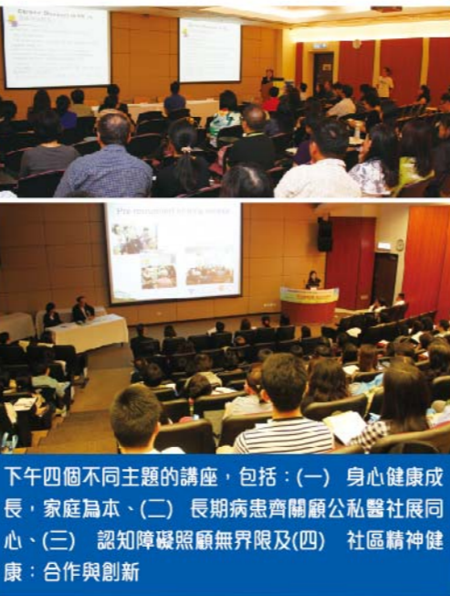
下午四個不同主題的講座，包括：(一) 身心健康成長，家庭為本、(二) 長期病患齊關顧公私醫社展同心、(三) 認知障礙照顧無界限及(四) 社區精神健康：合作與創新