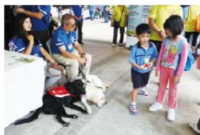
嘉年華共有45個精彩的攤位,有賣物、遊戲、手工藝,本年度還有小導盲犬的加入,令參加者樂而忘返。