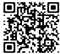
長者認知障礙症服務 (港島東)