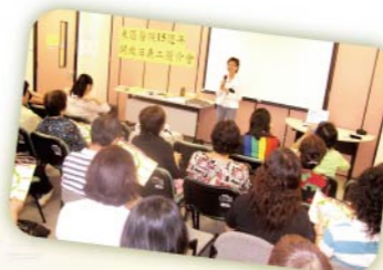
病人支援站 義工訓練