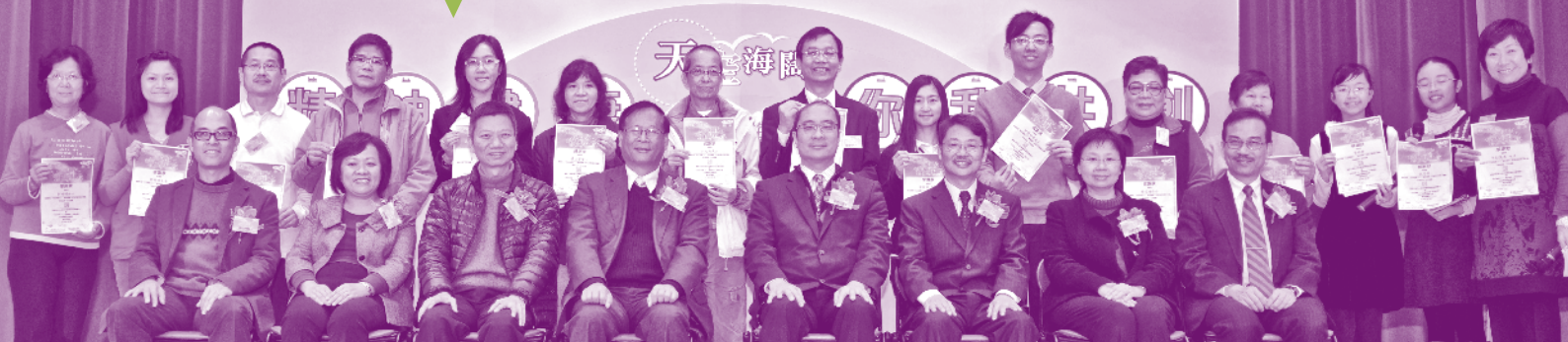
鯉漁涌社區會堂舉辦之「社區分享晚會」中，參加機構獲頒感謝狀，並向社區人士分享精神健康的訊息。