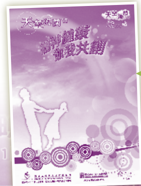
天空海闊(VI)印製了精神健康資源冊，派發給講座參加者及社區人士。