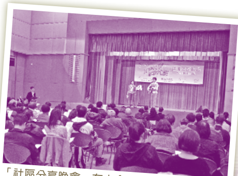
「社區分享晚會」在大合唱一曲《在晴朗的天空下》之後完滿結束，寓意醫社一起攜手參與，共創精神健康！