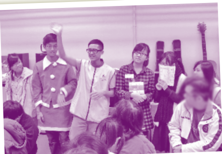
同學在參加講座後，自行籌組義務服務到本院樂民居探訪精神科病人，送上節日溫暖。