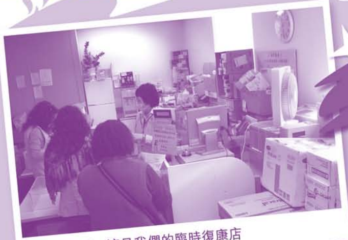
在裝修期間，這是我們的臨時復康店