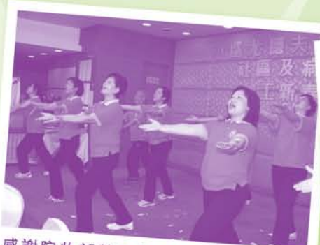
感謝院牧部義工表演讚美操，更教授「十巧手運動」，鼓勵義工多做運動，保持身心健康。