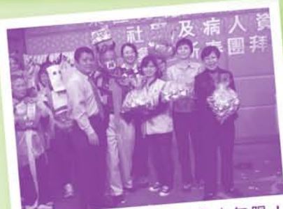
義工愛心無限外，創意也無限！看福牛選舉中勝出者的裝扮便可體會得到。