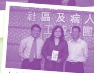
人人都希望抽到大獎，而今年的幸運兒就是這兩位義工。想下一年的幸運兒是你？記得參加義工新春團拜啦！