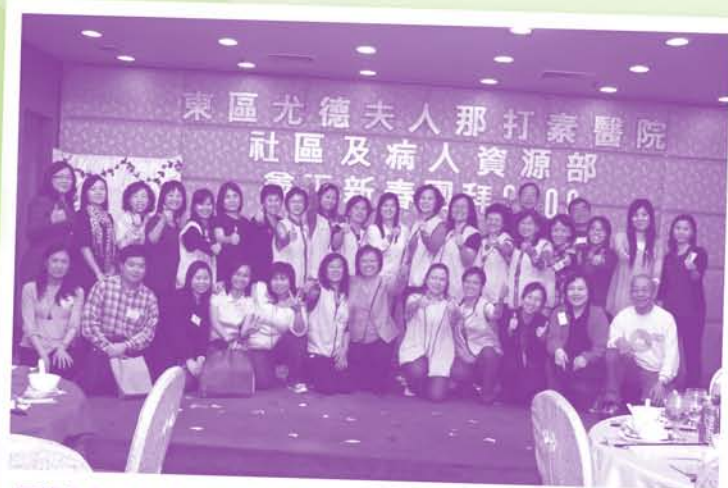
團拜之所以能順利舉行，帶給大家一個難忘的晚上，全賴一班籌委會義工及當日協助的義工，謹代表部門衷心多謝他們無私的付出。