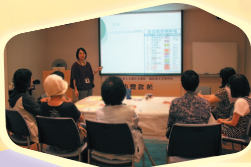
社工與參加者一起探討如何令自己快樂一些