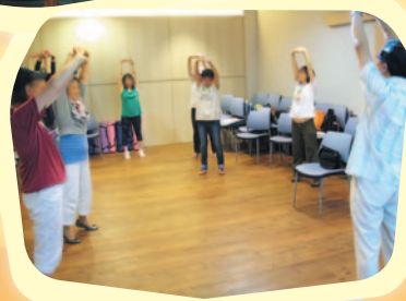
在小組中也會一起做學習做一些簡單的運動