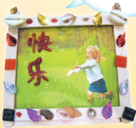
參加者自製相架提醒自己可以快樂