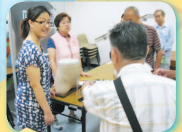
如果要洗腎，個肚就要預住4磅幾洗肚水