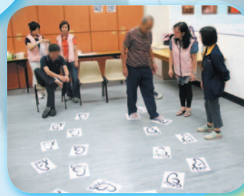
感受一下糖尿病人腳部遲鈍的感覺