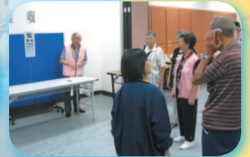
常聽人講糖尿病上眼，原來真係會好朦、好影響視力