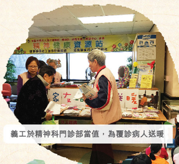
義工於精神科門診部當值，為覆診病人送暖