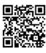
癌症病人社區資源