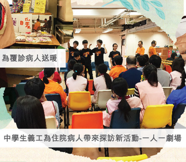
中學生義工為住院病人帶來探訪新活動-一人一劇場