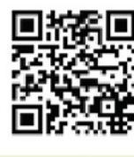
精神健康資源中心