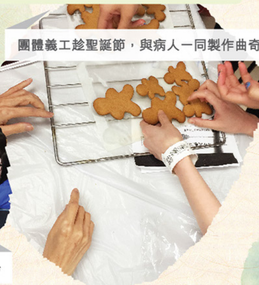
團體義工趁聖誕節，與病人一同製作曲奇