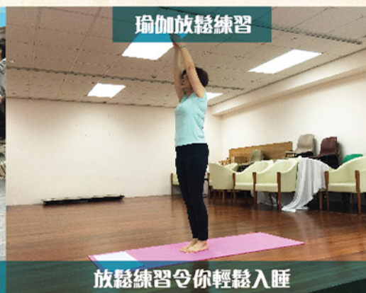
放鬆練習令你輕鬆入睡