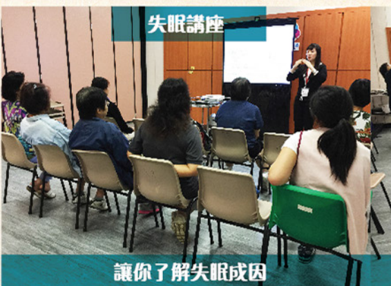
讓你了解失眠成因