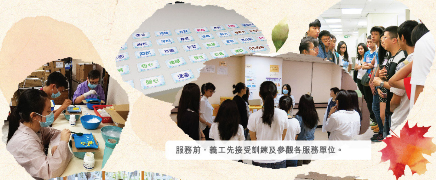
服務前，義工先接受訓練及參觀各服務單位。