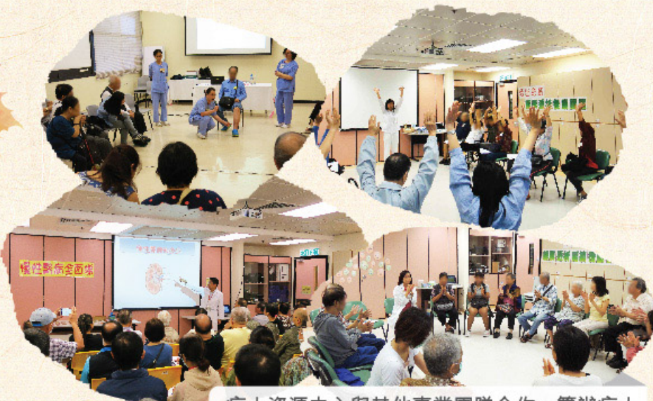
病人資源中心與其他專業團隊合作，籌辦病人賦能活動，關注腎友不同階段身心社交適應

關注病人的需要是全方位的，如與病人資源中心合作在復康店售賣腎科病人家用醫療用品，減輕病人及家屬頻撲多處購買的奔波，在復康店購買除了對醫院一站式從轉介到