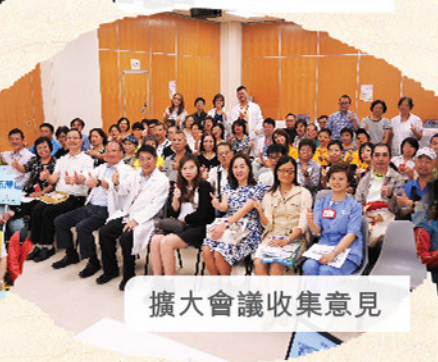
擴大會議收集意見