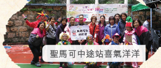
聖馬可中途站喜氣洋洋