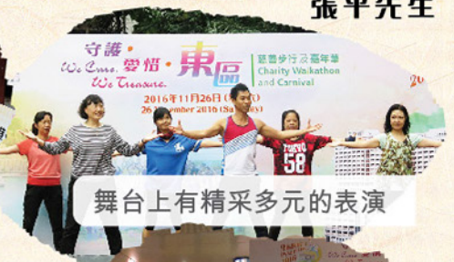
舞台上精采多元的表演