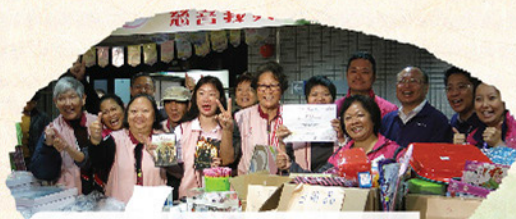
東區醫院義賣攤位踴躍叫賣