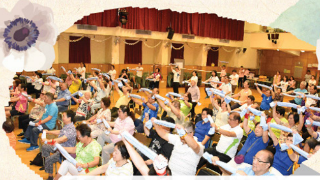
港島東醫院聯網糖尿病科運動同樂日

糖 尿病初期管理得好，日後衰退程度較慢，相反若初期管理差，日後病情就難以控制，甚至出現併發症。把握病人新症階段適時介入，糖尿病舉辦糖尿病教育日，邀請營養部及病人資源中心合作，讓新症病人有系統學習由糖尿病醫生、護士、營養師提供的糖尿病護理基礎知識，資源中心社工介紹社區資源，並有過來人分享自我管理的竅門。