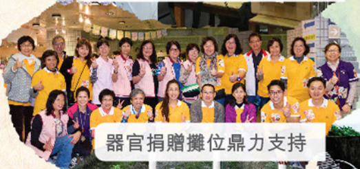
器官捐贈攤位鼎力支持