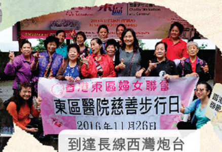
到達長線西灣炮台