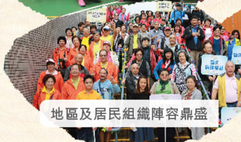
地區及居民組織陣容鼎盛