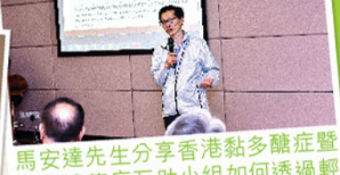
馬安達先生分享香港黏多醣症罕有遺傳病互助小組如何透過輕性手法向公眾及政府表達罕有病病人的需要。