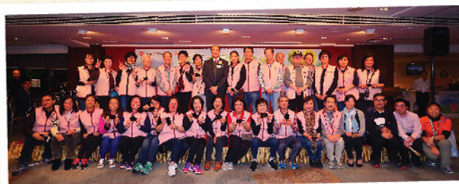
嘉許禮能夠順利完成，背後不少得一班核心義工於各個崗位上充份發揮合作無間的團隊精神，實在是當日的幕後功臣。