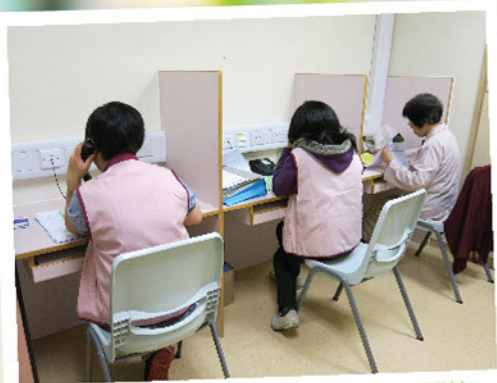
電話慰問義工每周默默地透過電話關懷出院的病人