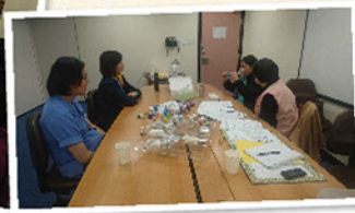
電話慰問義工訓練

病 人資源中心與呼吸科、老人科、骨科醫護，以及一眾義工通力合作為醫院出院病人提供電話關懷服務。服務由最初關懷出院長者，提醒他們有關防寒資訊的‘冬日特CALL隊’，發展及拓闊至多元化的慰問服務，包括：骨科換髌電話慰問、呼吸科電話慰問、長者防跌電話慰問，以及關懷參與了離院支援計劃的高危長者。各科的醫護人員更會定期為電話慰問義工提供訓練，以確保義工掌握最新的資訊。電話關懷服務能持續發展，實有賴一眾義工的付出，僅代表受惠病友，向他們致謝！