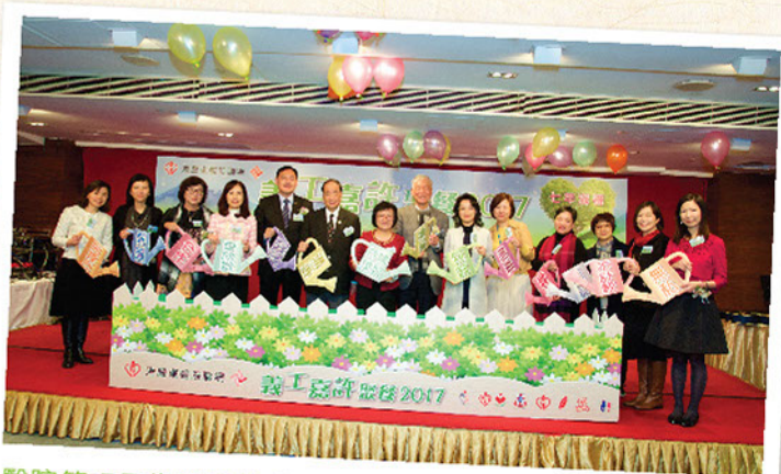
醫院管理層為開幕儀式注入「義工養份」，意味著聯網義工服務透過這些養份的滋養不斷茁壯成長。