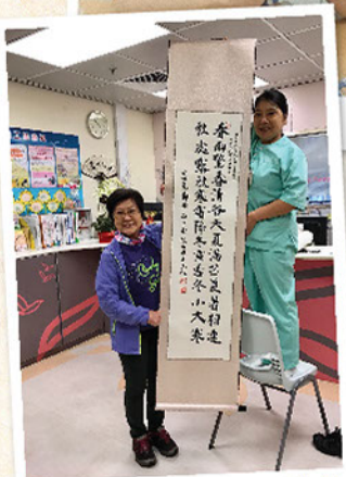
電話慰問義工獲服務使用者贈予親手寫的字畫，以感謝她用心的服務。