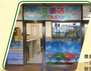
復康店於2018年中完成裝修，並推行一站式服務，病人可以在店內同時辦理會員咭申請及購買所需用品。

自2000年起，服務擴展至港島東醫院聯網轄下的醫院、普通科門診及外展(老人院)，使更多有需要的病人受惠。近5年，復康店更在會員制度(永久會員制、即時發咭)、零售系統(簡化購物類別)、付款系統(增設八達通)上作出更新，讓病人得到更大的方便。