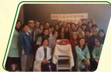
醫護團隊及管理層藉著年度聚餐以表示對復康店義工的感謝，亦可了解更多服務上的運作，互相交流意見以協助訂定發展方向。