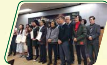
頭頸癌病人參加呼吸發聲技巧訓練班後，掌握了唱歌技巧，自信大大提升，在聖誕節時更與導師同台表演。