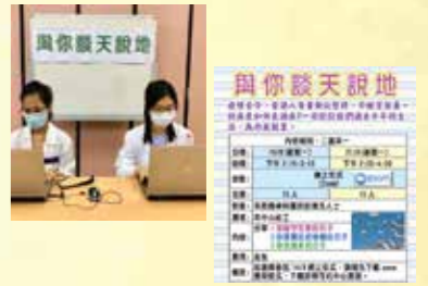
「與你談天說地」活動透過網上形式(Zoom)，與會員暢談疫情下的新常态，互相分享生活點滴和正能量，為大家加添面對「疫」境的信心。

精神健康資源中心在疫情下繼續與精神科病人保持溝通，在不能相見的日子中心多走一步，盼望病人縱然未能參與中心活動，甚至擔心往返醫院的時候，我們透過一系列關懷行動包括心靈茶包、祝福卡、疫情通訊、疫情號外及如何下載zoom等資訊郵寄給中心會員；又安排在精神科門診的醫生房放置祝福卡，讓覆診病人也感受到關懷溫暖。同時又於精神科復康病房進行視像探訪；此外亦以電話慰問恆常服務精神科的義工朋友。而原訂在第三季恢復實體活動的時候，卻遇上新一輪疫情肆虐以致實體活動被迫再度擱置，中心改以網上形式繼續推行原安排的活動，盼望在疫情持續下繼續為精神科病人提供服務，達致「一同學習，與時並進」。