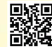
「港島東健康資源網」的網址為 https://www.healthyhkec.org

為促進「醫」及「社」的交流及讓病人獲得一站式的資訊，港島東醫院聯網社區服務於2006年建立了一個跨病類的社區復康資訊平台 - 港島東健康資源網，當中集合了由醫護團隊製作的疾病管理資訊，以及由社區伙伴提供的社區服務資訊等等。針對不同的病類，社區服務亦製作了多款名為「社區資源導航系列」的二維條碼(QR CODE)資訊卡，讓病患者及家屬能透過智能手機的二維條碼應用程式，即時連結網站瀏覽或下載有關資訊，以掌握最新及相關的社區復康資源。在新型冠狀病毒疫情期間，網站亦與不同的醫護團隊及社區伙伴合作，上載各類型的抗疫資源，與大家一起在家抗疫。