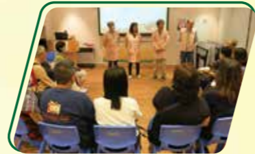
新確診的病人及家屬參加了「新症導航」，由康復者分享抗癌經歷，鼓勵新症病人勇敢面對！

苦中一點甜，癌症病人資源中心希望在艱辛的治療過程中能為病人提供身·心·靈的支援，讓病人在抗癌路上不孤單！