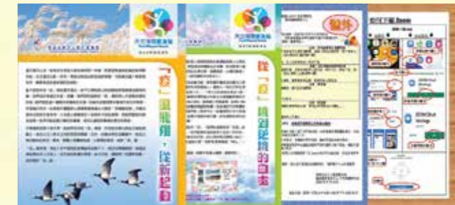
中心出版疫情通訊、疫情號外及如何下載 zoom 等資訊，分享「疫」境的正向思想、經驗、應對的方法等，鼓勵大家一起積極面對「疫」境。