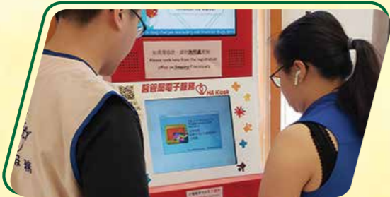
醫院接待大使去年伸延服務至專科門診大樓中央登記處，協助服務使用者順利使用新設立的自動繳費亭。

在年初疫情開始不久，本院義工服務雖然隨著醫院管理局緊急應變級別而全面暫停，但義工們對病人、家屬和醫院同事的支持不斷，仍然透過不同的形式送上打氣的正能量，令人感動。那打素病人資源中心在疫情下亦與朋輩義工、病人組織及社區伙伴保持聯繫，關懷他們面對疫情中情況及勉勵保持健康。