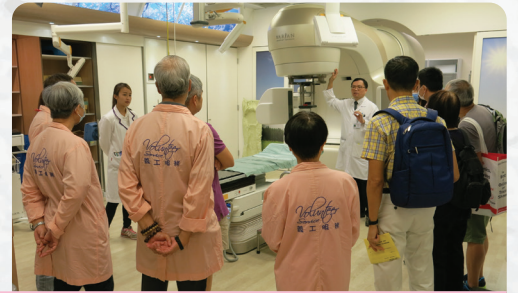
朋輩義工與新症病人及家屬參觀電療室

由朋輩義工帶領下參觀不同的部門，如腫瘤科綜合日間中心、放射治療部等等，讓病人在接受治療前對各方面的治療程序增加認識，以減低不安等心理壓力。