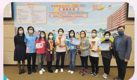
有賴義工踴躍支持，那打素義工中心榮膺最高籌款額獎（團體）