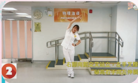
由物理治療師帶領進行健身操

「東區醫院日」是東區尤德夫人那打素醫院年度盛事，旨在籌款改善醫院服務，加強社區伙伴合作，以及凝聚員工團隊精神。「東區醫院日2022」已於去年11月26日順利舉行，今次大會以「守護·同行」為題，表示東區醫院與社區各界並肩同行、一同守護社區的決心。活動當日除了啟動儀式及頒獎禮外，亦有健康運動環節、「正向思維」健康講座、以及社區組織精彩表演。因應新冠肺炎疫情，今次繼續以線上廣播形式舉行，方便社區各界能夠一同參與。大會亦得到社區伙伴的鼎力支持，於地區不同的服務中心提供場地並進行轉播予屬下的會員及服務使用者一同觀賞各項線上節目，並將活動資訊轉送開去，讓更多社區人士一同參與。