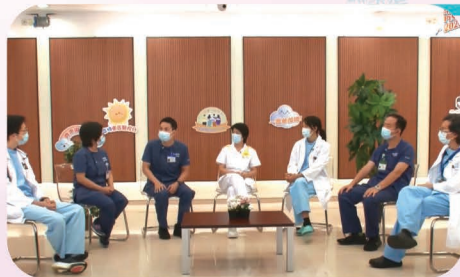
由醫護及專職醫療同事主持線上健康講座