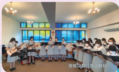
不同社區組織為東區醫院日進行精彩表演