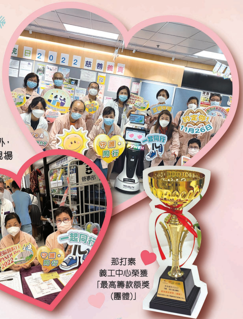
那打素 義工中心榮獲 「最高籌款額獎 (團體)」

除了11月26日舉辦「東區醫院日」線上節目轉播之外，大會亦於11月11日舉辦「東區醫院日」慈善義賣，現場有自家製品、嘉美雞券、造型汽球、書籍、手工藝品、飾物及餐具等產品。當日有很多醫院同事參與，氣氛相當熱鬧，另外那打素義工中心一班義工亦到場協助義賣攤位，使活動得以順利進行。