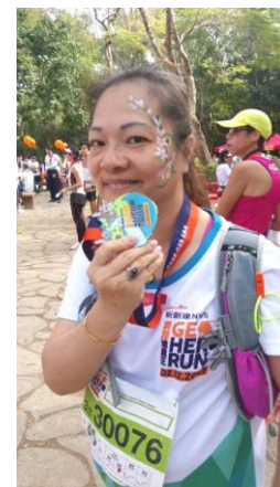
『順利完成 3 公里“英雄勇跑”』