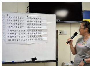
有趣又益智的遊戲環節“猜字謎”