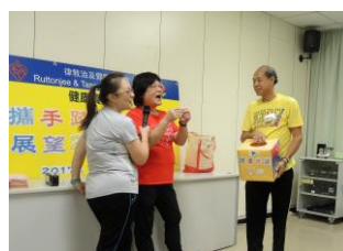
抽獎時刻總是令人興奮不已