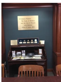
EPJ 的工作檯仍存放在加斯林糖尿病中心的博物館內

診所其後遷移發展，1953 年正式成為加斯林診所 (Joslin Clinic)。1956 年，EPJ 把診室搬到了現址 One Joslin Place。1957 年，糖尿病治療和教育中心模型的理想實現了，成立了第一個有教室、教學廚房和運動室的糖尿病中心。患者需停留一週左右，在更現實的環境中盡可能地多了解糖尿病。