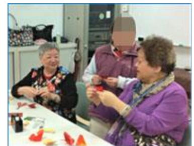
程女士教健糖會員摺紙蝴蝶